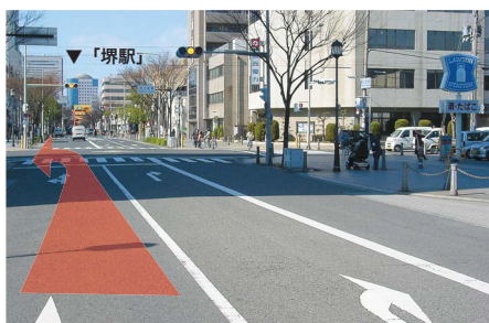
7 右手にローソンが見える交差点を左に曲がります。