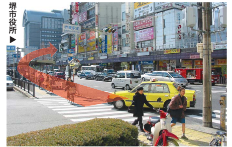
3 エスカレーターを降りられたら、正面奥の市役所へお進み下さい。