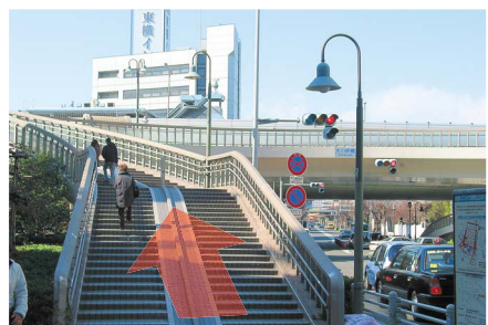
5 郵便局の先に歩道橋がありますので、「東横イン」の看板を目指してお進み下さい。