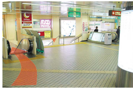
2 南口改札を出られたら、すぐにエスカレーターを降りて下さい。