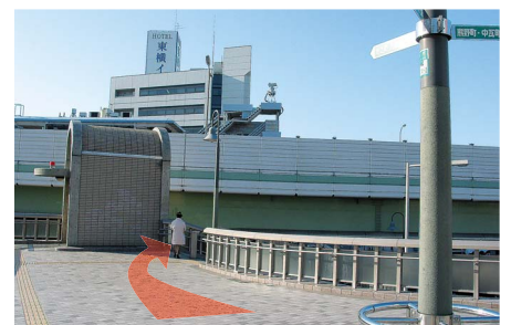
6 「東横イン」の看板右側から歩道橋を降りて下さい。