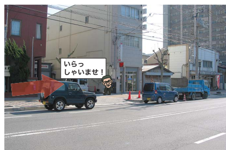
8 ヘリオス大阪に到着です。